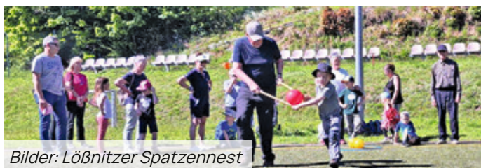
Bilder: Lößnitzer Spatzennest

Großeltern spielen eine ganz besondere Rolle im Leben ihrer Enkel und umgekehrt. Deshalb plante das Team der Kita Spatzennest dieses Jahr erneut einen Oma-Opa-Nachmittag, der für den 13.05.2024 angedacht war.