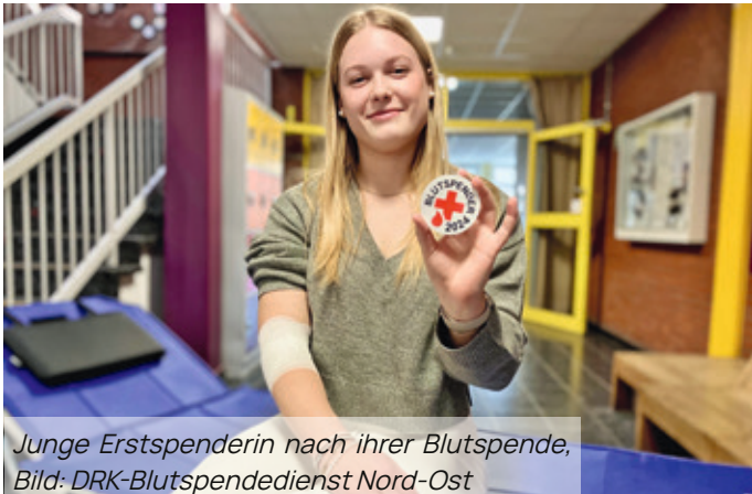
Junge Erstspenderin nach ihrer Blutspende, Bild: DRK-Blutspendedienst Nord-Ost