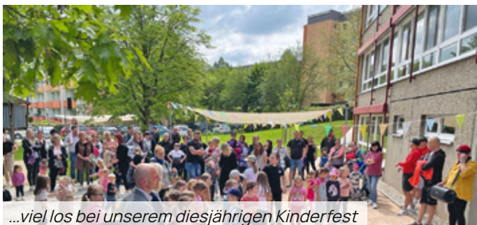
...viel los bei unserem diesjährigen Kinderfest