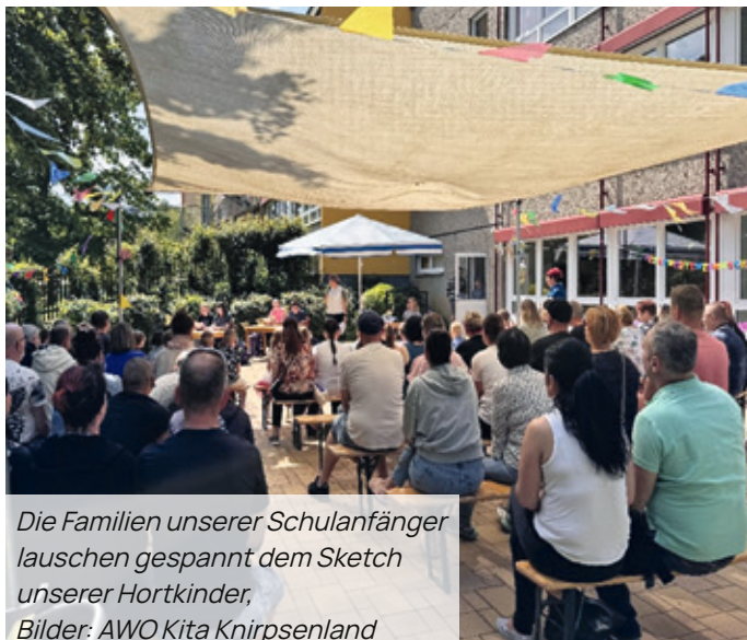
Die Familien unserer Schulanfänger lauschen gespannt dem Sketch unserer Hortkinder

Dabei blieb kein Auge trocken ... Viele Emotionen gab es anschließend auch, als die gefüllten Zuckertüten endlich in Empfang genommen werden durften! Der Abend klang bei schönstem Sonnenschein in gemütlicher Runde bei Pizza im Garten unserer Einrichtung aus.