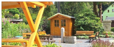
„De Bichrbud“

Die Bücherbude ist ein Ort des Austauschs und der Begegnung.