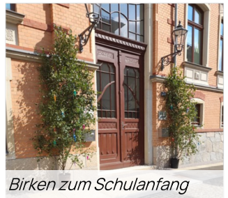
Birken zum Schulanfang

Auch unser diesjähriger Lesecub hat begonnen und die ersten Clubtreffen haben bereits in unseren neuen Vereinsräumen in der Oesfeldstraße stattgefunden. Diesmal mussten wir in die Werkstatt ausweichen, da im vorderen Raum die Klöppler tätig waren.