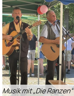
Musik mit „Die Ranzen“

Ein großes Lob und herzlichen Dank an unsere Jugend.