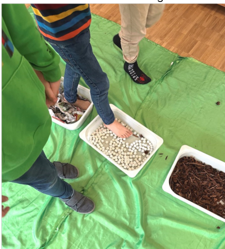
Sinnespfad, Bilder: Kinderhort Muhme-Kids

Michelle Schmuck - „Muhme-Kids“ Kinderhort Altstadt