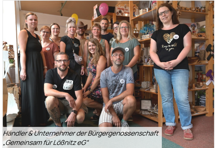
Händler & Unternehmer der Bürgergenossenschaft „Gemeinsam für Löbnitz eG“