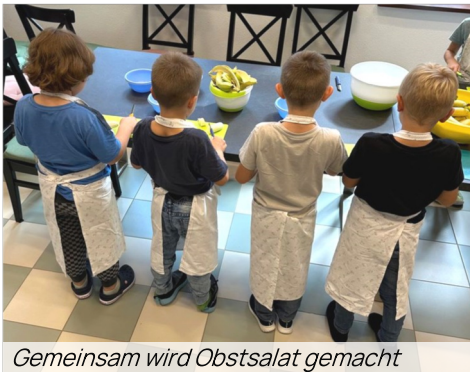
Gemeinsam wird Obstsalat gemacht