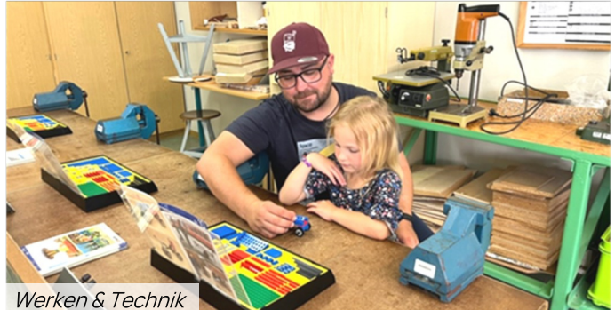
Werken & Technik

An verschiedenen Stationen der Schule wurde ein Einblick in die Angebote unseres Schulalltages gezeigt: verschiedene Lernmaterialien für