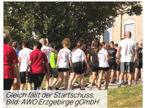
Gleich fällt der Startschuss

Die Erwachsenen hingegen zeigten eine Stunde lang bei einem Rundkurs im Klinikgelände ihr sportliches Können. Alle waren hochmotiviert und trotzten den heißen Temperaturen.