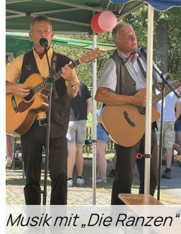
Musik mit „Die Ranzen“

Ein großes Lob und herzlichen Dank an unsere Jugend.