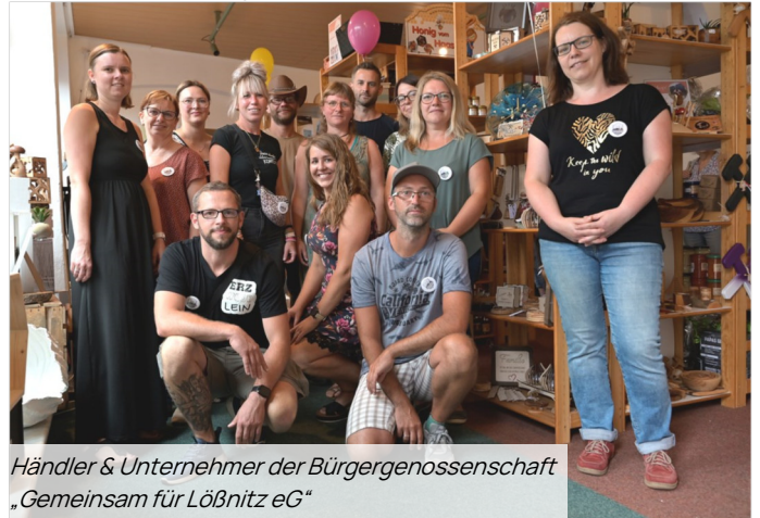
Händler & Unternehmer der Bürgergenossenschaft „Gemeinsam für Löbnitz eG“