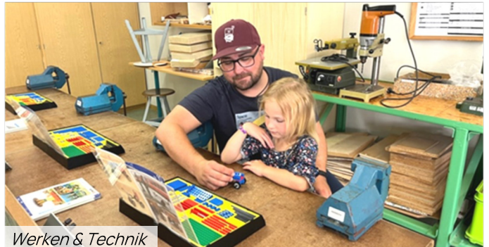
Werken & Technik

An verschiedenen Stationen der Schule wurde ein Einblick in die Angebote unseres Schulalltages gezeigt: verschiedene Lernmaterialien für